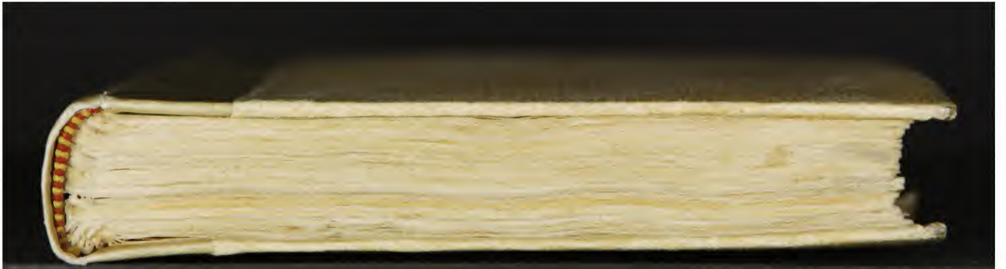
Early European Books, Copyright © 2011 ProQuest LLC. Images reproduced by courtesy of the Biblioteca Nazionale Centrale di Firenze. Magl. A.5.64